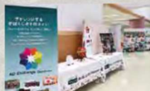
(あおいニッセイ同和損害保険株式会社)