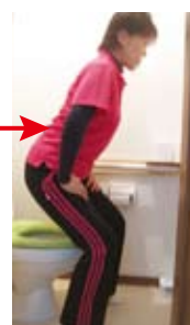
トイレから出る前に立ち座り(スクワット)